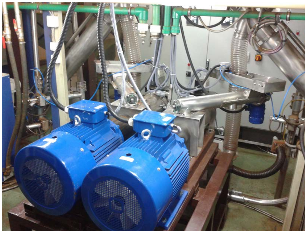
Device picture: /Foto uređaja/